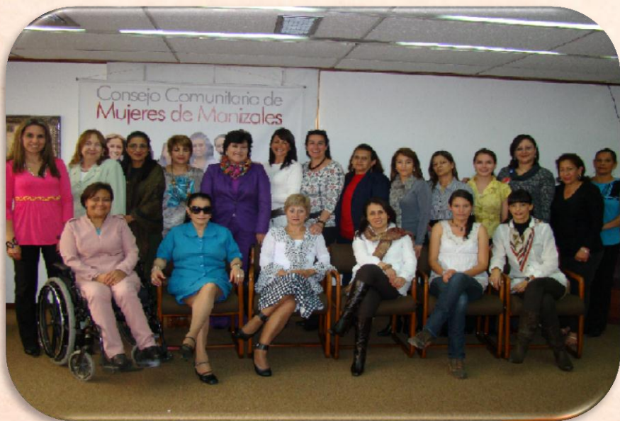
CONSEJO COMUNITARIO DE MUJERES DE MANIZALES 2011