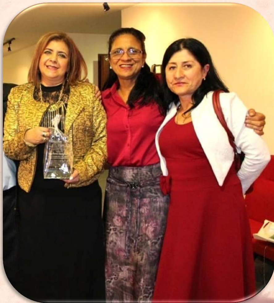
FUNDADORES CONSEJO COMUNITARIO DE MUJERES 2018